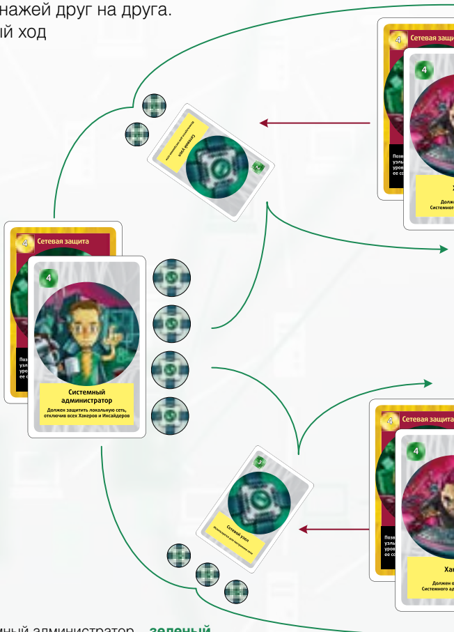
Схема взаимодействия ролевых карт (топология сети). Стрелками показана возможность влияния персонажей друг на друга. Первый ход

Системный администратор – зеленый , хакеры – красный , инсайдер – синий .